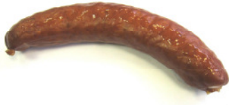
Artikel-Nr. 80398 Saucisson maison ca. 200g