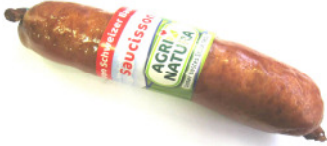
Artikel-Nr. 80575 Saucisson fumé ca. 350g