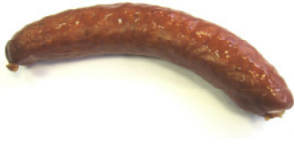
No article 80398 Saucisson maison env. 200gr.