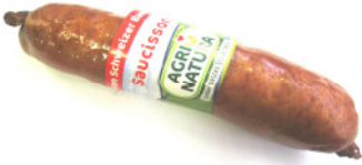
No article 80575 Saucisson fumé env. 350gr.